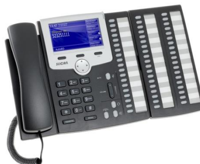
CTS-330 z konsolą CTS-338

Profil telefonu jest tworzony i przechowywany w pamięci centrali Slican dlatego z telefonu można korzystać natychmiast po włączeniu go do sieci, bez skomplikowanego i czasochłonnego programowania. Programowalne przyciski BLF pozwalają na indywidualne kreowanie funkcji, usług, czy też tworzenie listy podręcznych kontaktów. Dla wygody i zwiększenia liczby przycisków szybkiego wyboru, użytkownik może podłączyć do telefonu systemowego serii CTS-330 do 4 konsol Slican CTS-338, zwiększając ilość programowalnych przycisków do 171.